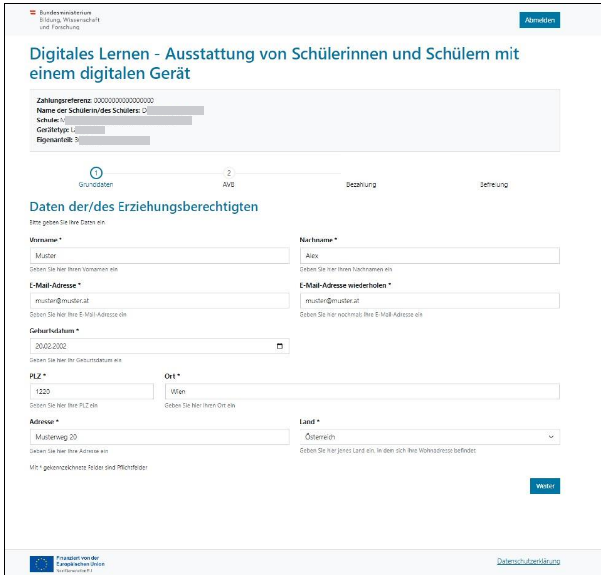
صورة 4: نموذج توضيحي مملوء بشكل صحيح